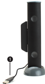
① USB power cable Câble d'alimentation USB Cable de USB USB Stromkabel USB电源线