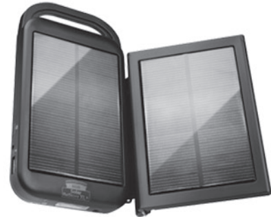
ReVIVE™ Solar ReStore™ XL+