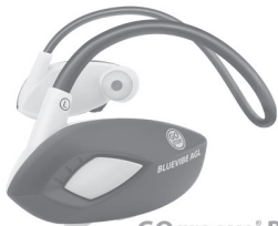
GOgroove® BlueVIBE® AGL