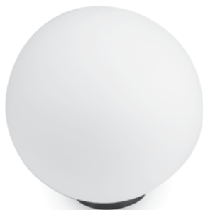
ENHANCE® MOOD LIGHT M